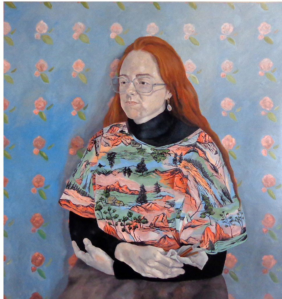
Retrato de una pintora Óleo sobre lienzo 100 x 100 cm 2022