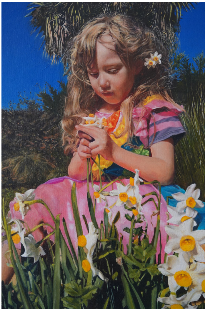
Elisa y los narcisos Óleo sobre lino 40 x 50 cm 2021