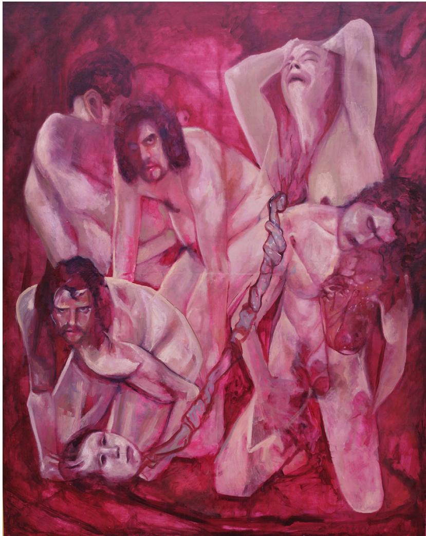
Gruta Óleo sobre cortina blackout 155 x 130 cm 2022