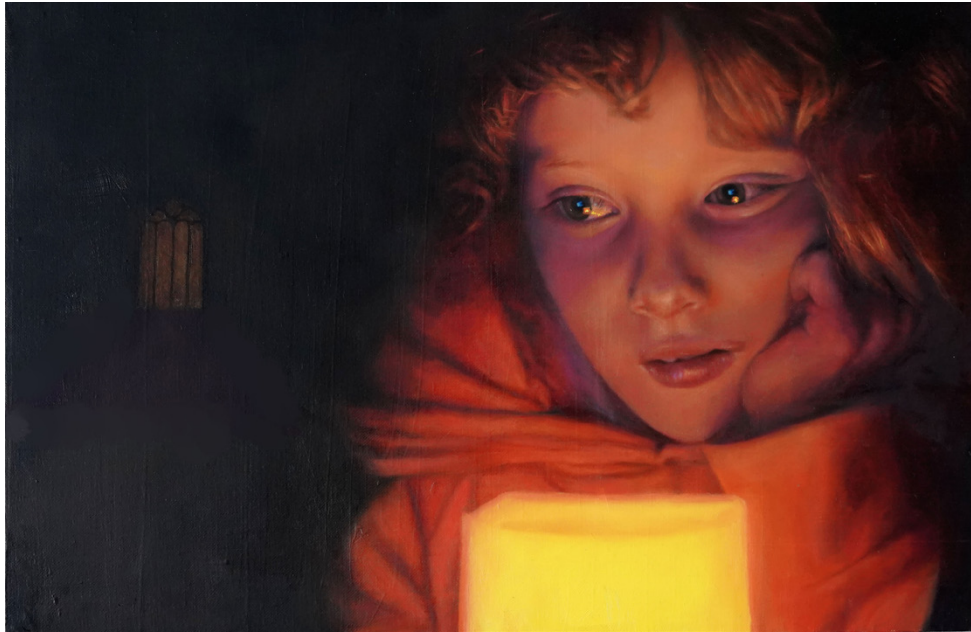
La ventana Óleo sobre lino 40 x 60 cm 2023