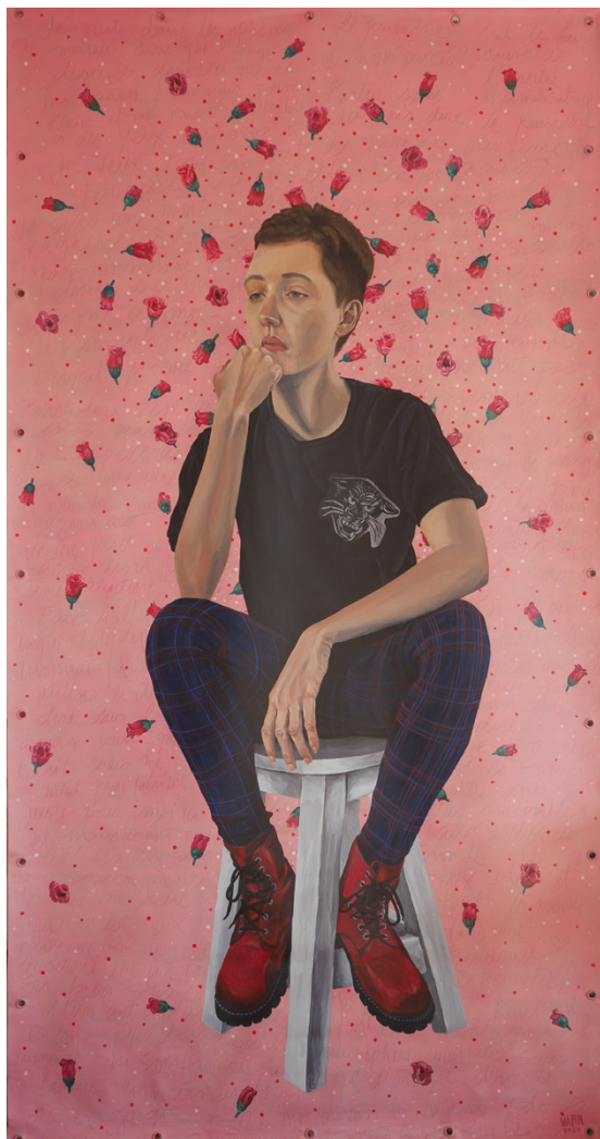
Lxs Pensadorxs Acrílico sobre lienzo 210 x 110 cm 2021