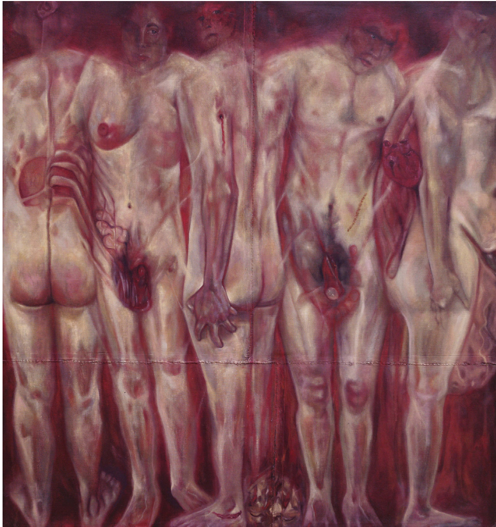
Carnes iluminadas Óleo sobre telas reutilizadas y zurcidas 150 x 155 cm 2022