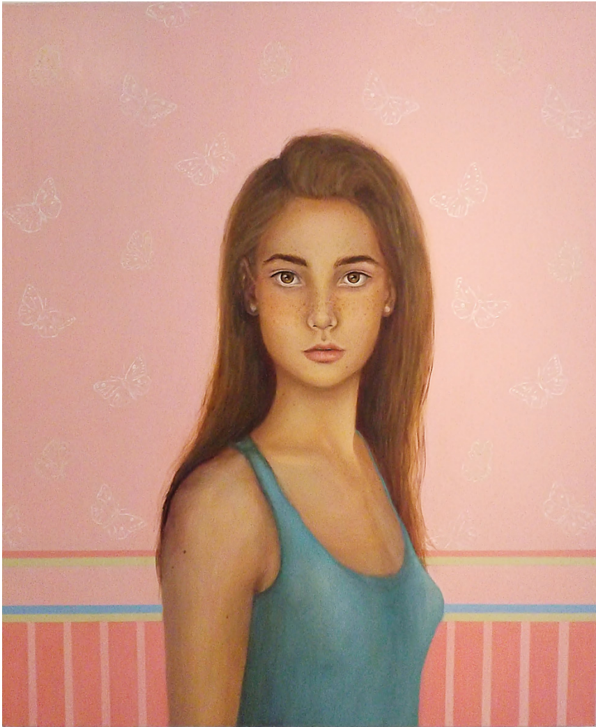
Serie: Dulce Atracción Acrílico sobre tela 100 x 120 cm 2014