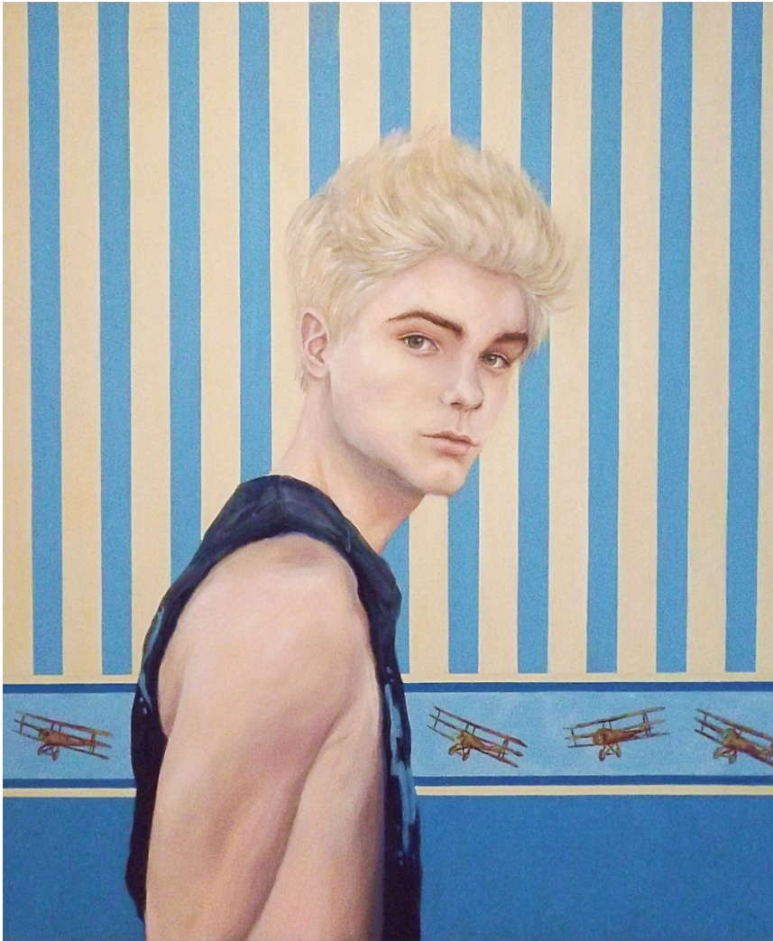
Serie: Dulce Atracción Acrílico sobre tela 100 x 120 cm 2014