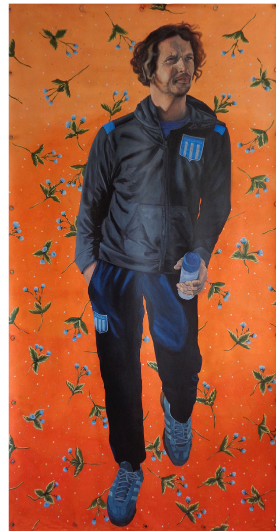
El Racing Acrílico sobre lienzo 210 x 110 cm 2022