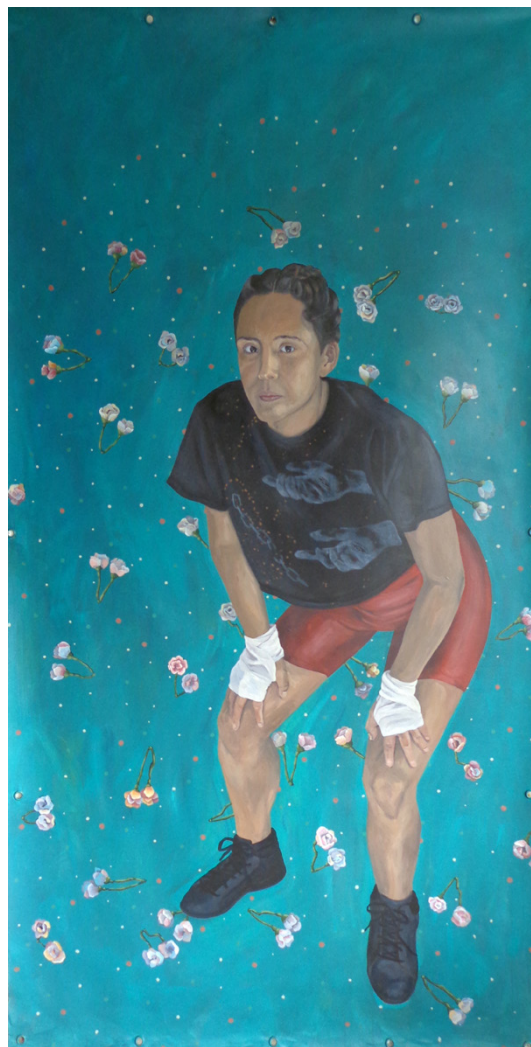
Sin título Acrílico sobre lienzo 210 x 110 cm 2022