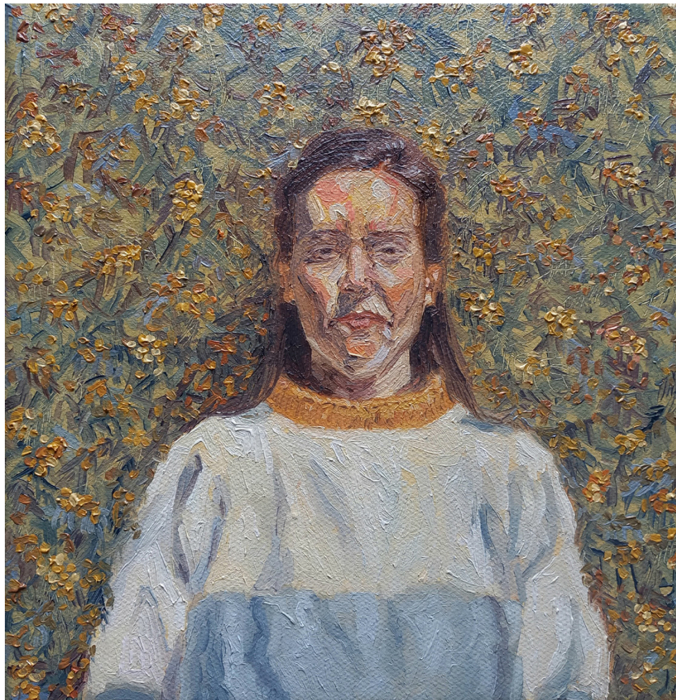
Sol de invierno Óleo sobre lienzo 20 x 20 cm 2023