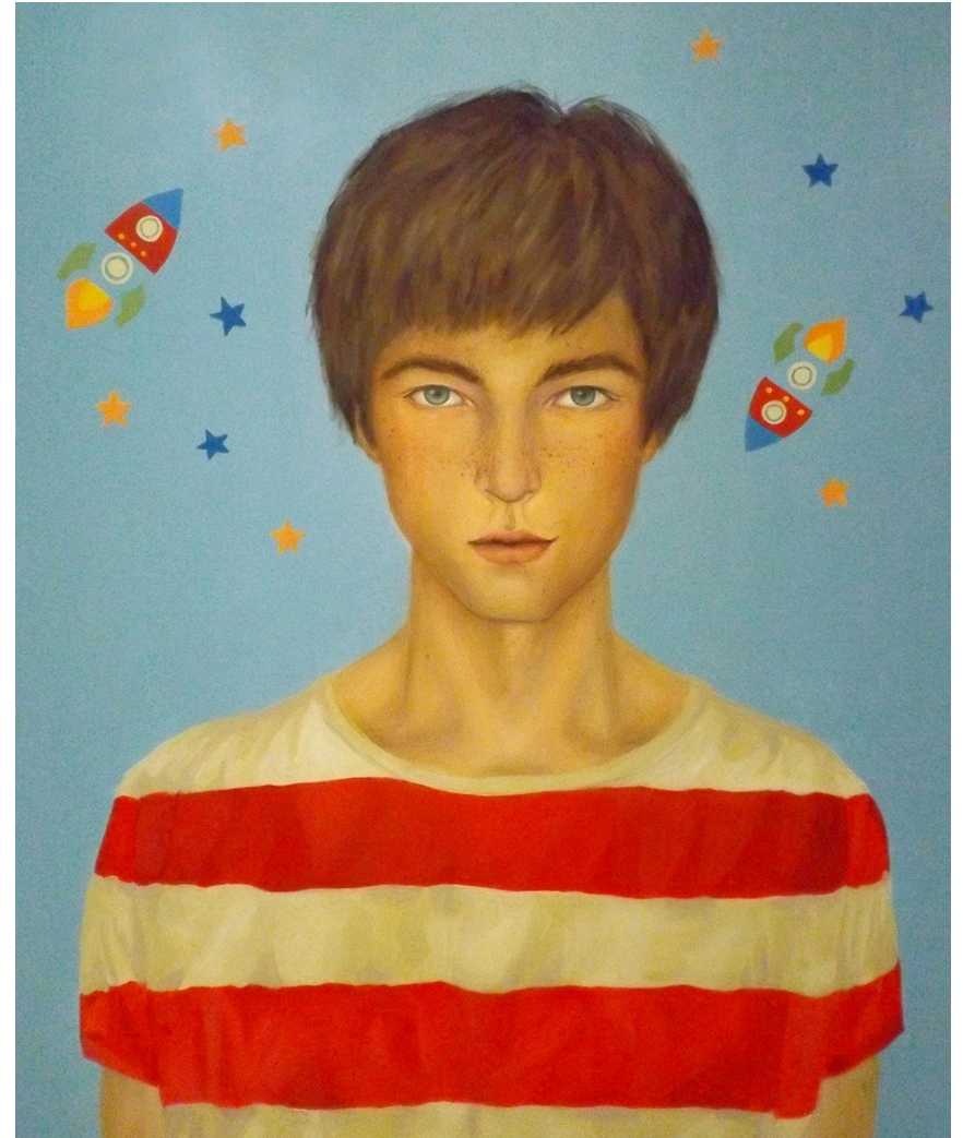
Serie: Dulce Atracción Acrílico sobre tela 100 x 120 cm 2014