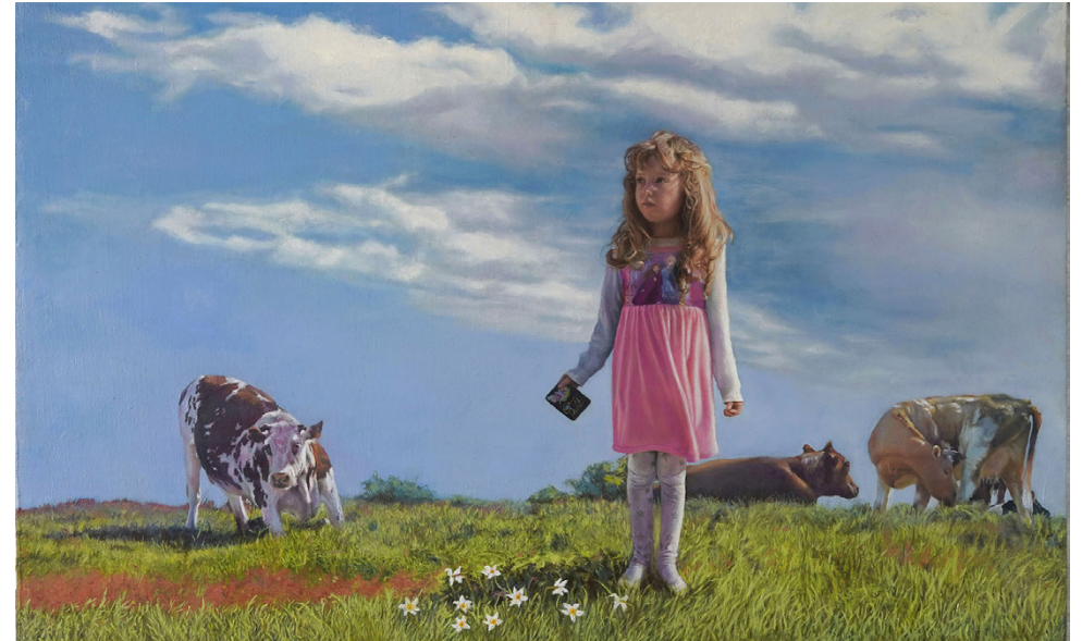
Diálogo Silencioso Óleo sobre lino 50 x 80 cm 2022