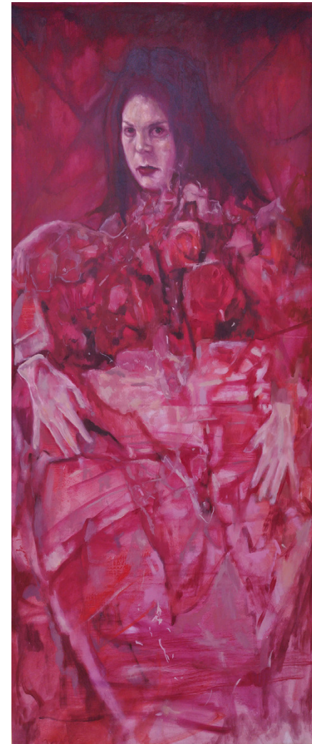
Acaricia Óleo sobre cortina blackout 150 x 65 cm 2023