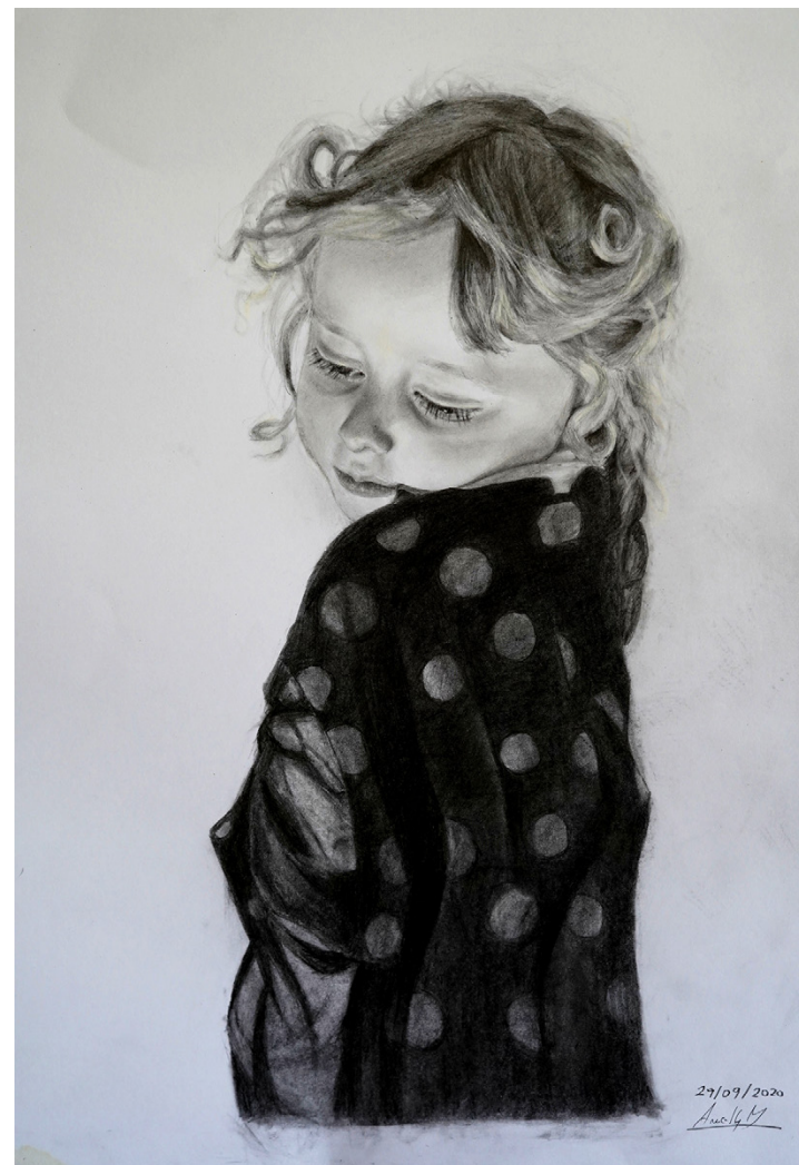
Retrato de mi hija de 4 años Carbón sobre papel canson 45 x 55 cm 2020