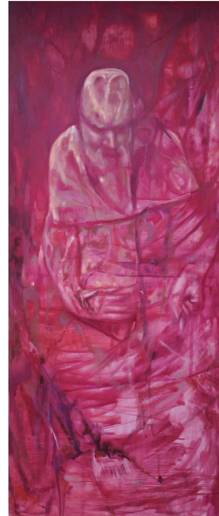
La vejez Óleo sobre cortina blackout 150 x 65 cm 2023